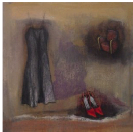
Ismael Mundaray © 2003

J'ai vu des jupettes Qui m'ont fait blêmir De belles gambettes Dont je ne saurais dire Si c'est la forme douce Qui nourrissait mes fantasmes Ou la longue pousse Qui allumait ma flamme Mais ce que je sais C'est qu'un peu de chair fraîche A pu décocher Dans mon cœur quelques flèches Et qu'un bout de tissu Formé de quelques plis À ce point m'a ému Que j'en suis tout épris